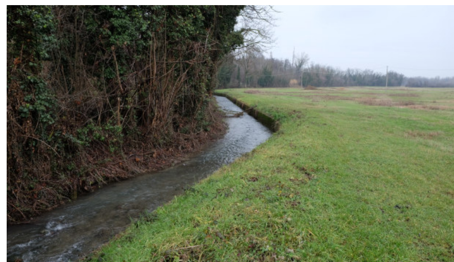
Foto 15: Tratto del Canale della Spelta nel settore Sud occidentale dell'Ambito estrattivo 'Cà Campagna/Boschi' da Sud