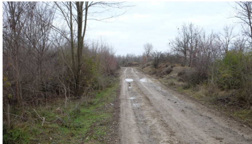
Foto 17: Tratto di pista camionabile in fregio al T. Enza che sarà utilizzata per il trasporto dei materiali da Nord