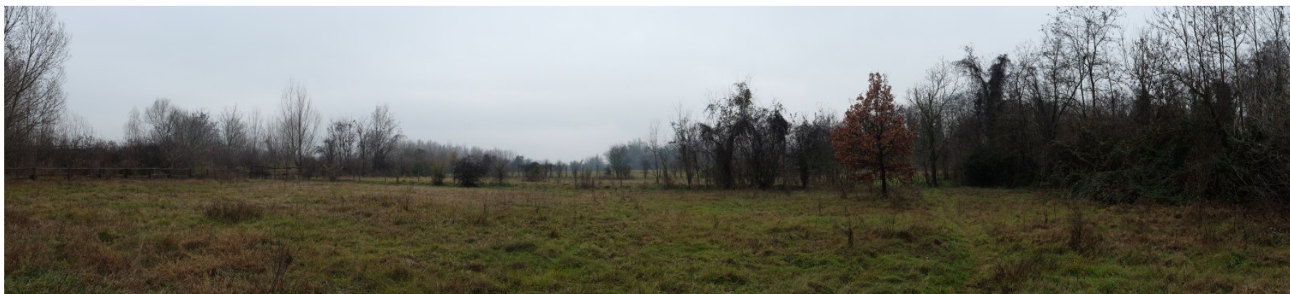
Foto 4: Panoramica del settore settentrionale dell'Ambito estrattivo 'Cà Campagna/Boschi' da Nord