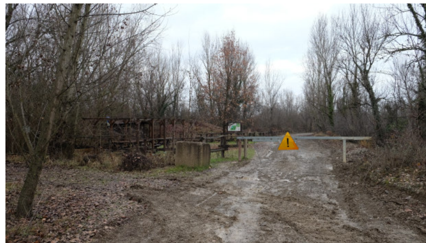
Foto 9: Punto sosta attrezzato e sbarra in corrispondenza del tratto finale del tragitto previsto dal vigente PAE di collegamento alla pista in fregio al t. Enza (da Sud):