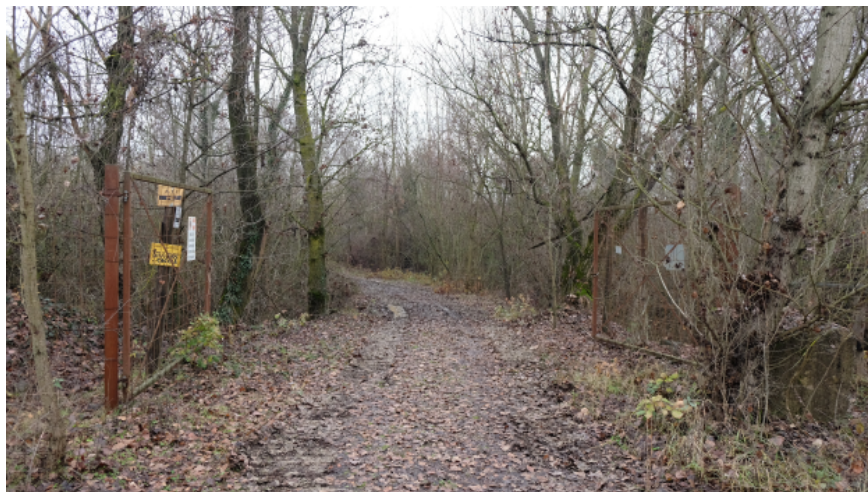
Foto 8: Tratto finale del tragitto previsto dal vigente PAE di collegamento alla pista in fregio al t. Enza da Est