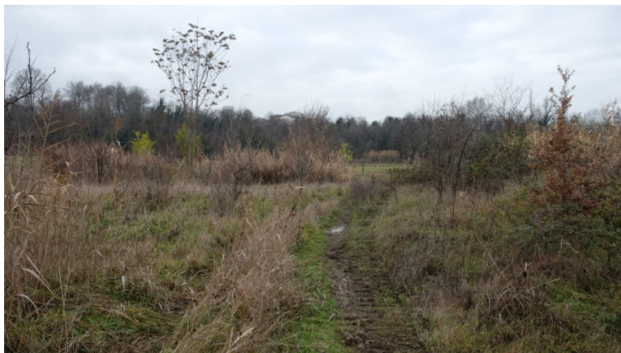
Foto 6: Tratto iniziale del tragitto previsto dal vigente PAE di collegamento alla pista in fregio al t. Enza da Est