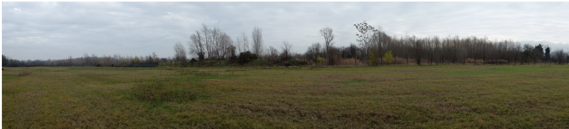
Foto 5: Panoramica settore orientale dell'Ambito estrattivo 'Cà Campagna/Boschi' da Ovest