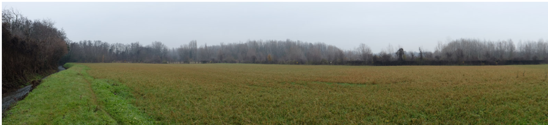
Foto 3: Panoramica del settore centro-settentrionale dell'Ambito estrattivo 'Cà Campagna/Boschi' da Ovest