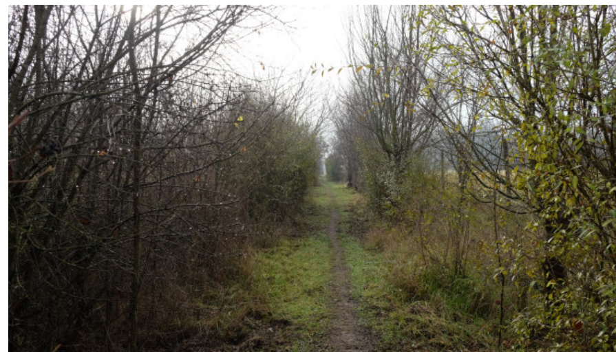
Foto 21: Sentiero pedonale per la fruizione di tipo 'naturalistico' dell'area da Nord