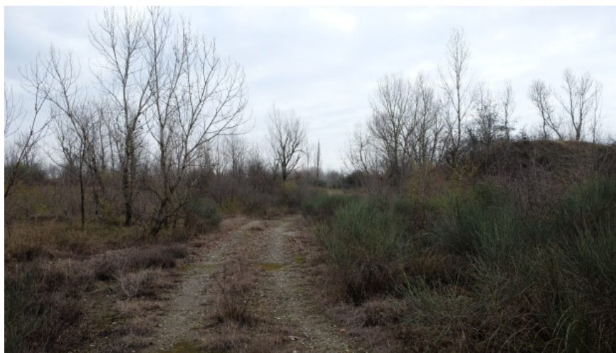
Foto 10: Tratto iniziale del tragitto alternativo di collegamento alla pista in fregio al t. Enza da Ovest