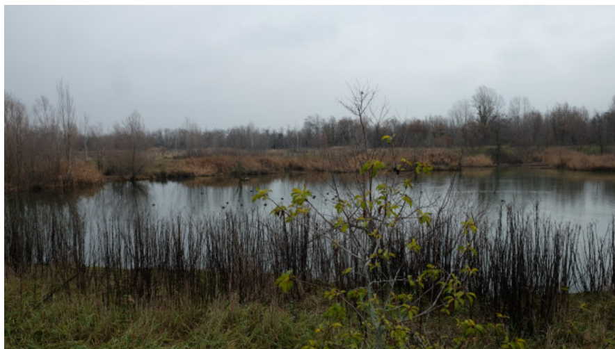
Foto 18: Area estrattiva rinaturata a zona umida nell'ambito della precedente fase attuativa all'interno del medesimo Polo G6 da Ovest