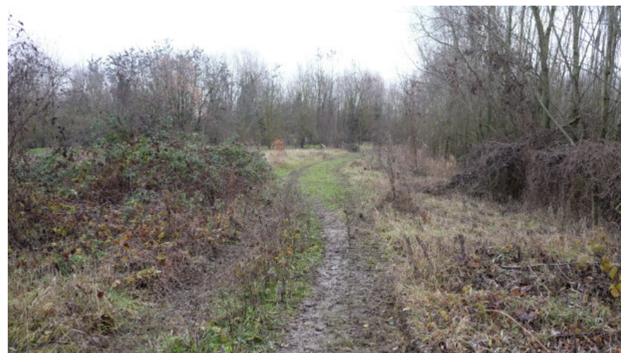
Foto 2: Tragitto previsto dal vigente PAE di collegamento alla pista in fregio al t. Enza da Ovest