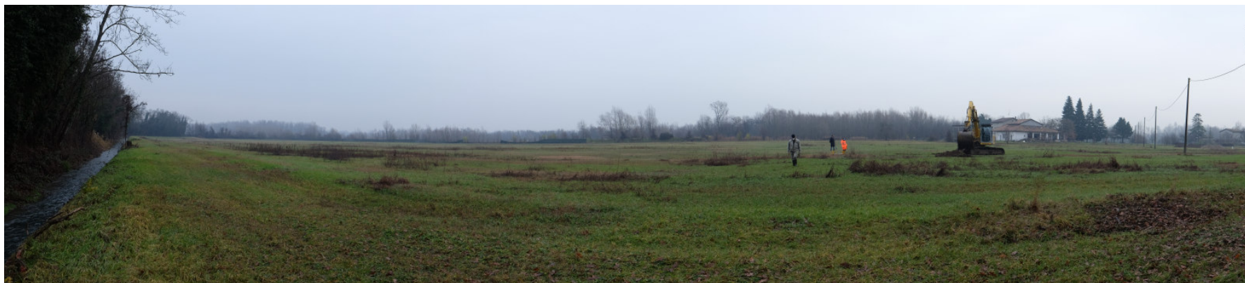
Foto 1: Panoramica dell'Ambito estrattivo 'Cà Campagna/Boschi' da Sud – Ovest