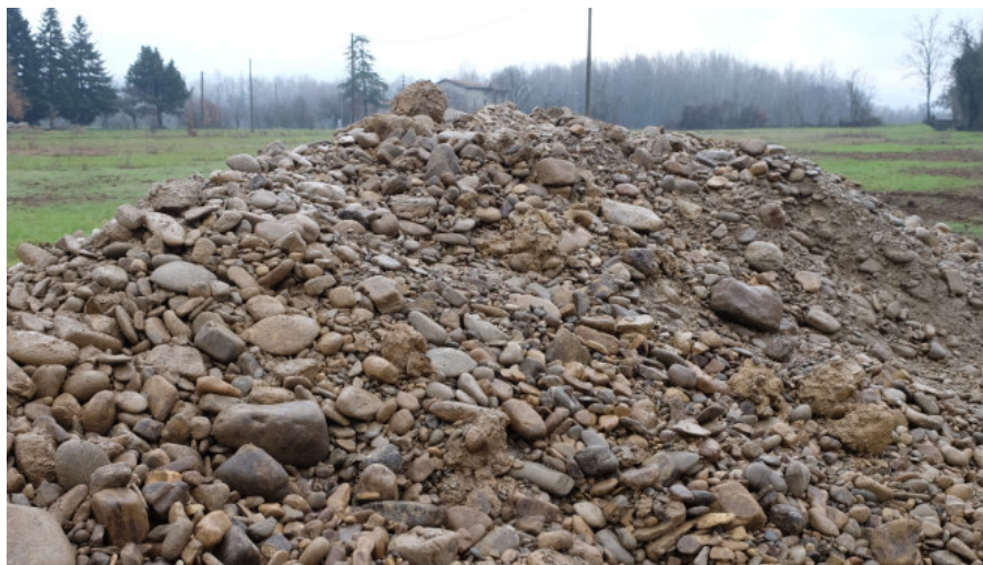
Foto 12: risorsa temporaneamente estratta durante la realizzazione dei pozzetti esplorativi per l'osservazione diretta