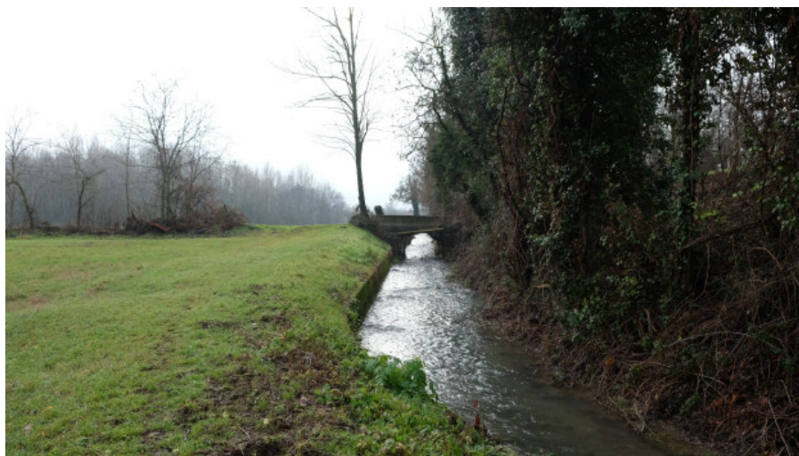
Foto 14: Tratto del Canale della Spelta nel settore Sud occidentale dell'Ambito estrattivo 'Cà Campagna/Boschi' da Nord