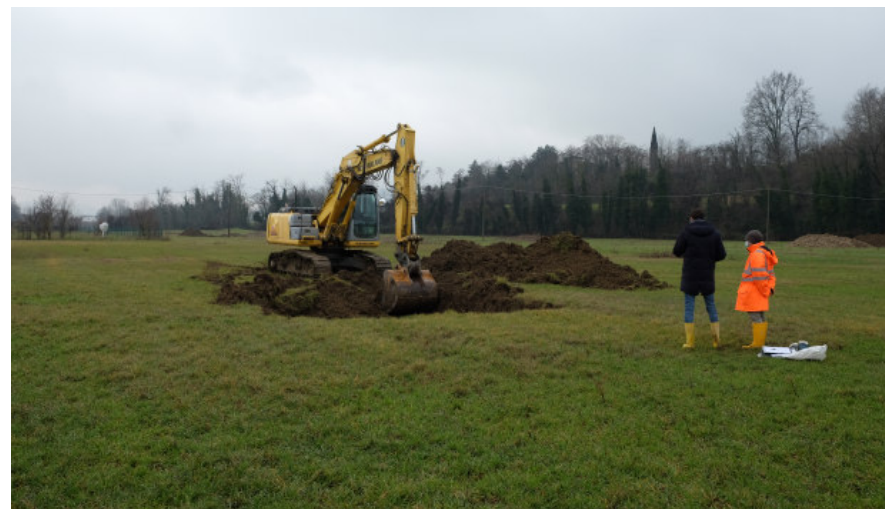
Foto 13: Campagna geognostica per la caratterizzazione giacimentologica