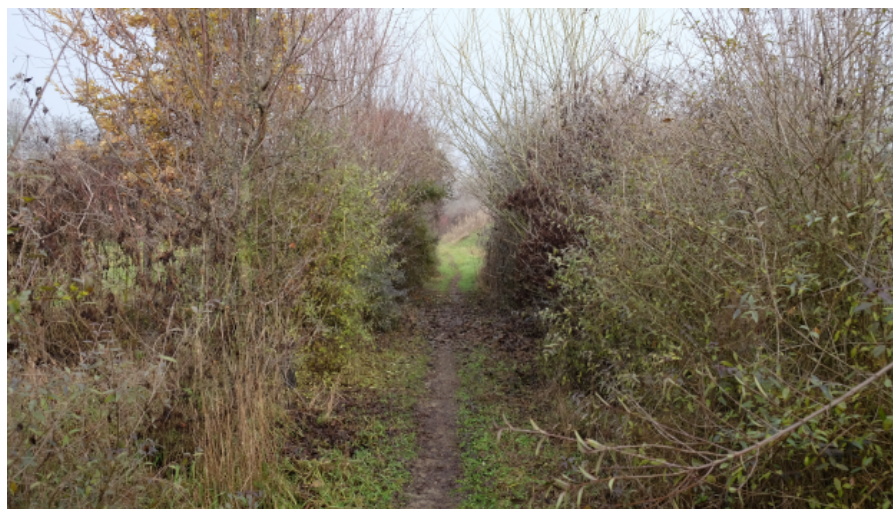
Foto 20: Sentiero pedonale per la fruizione di tipo 'naturalistico' dell'area da Nord