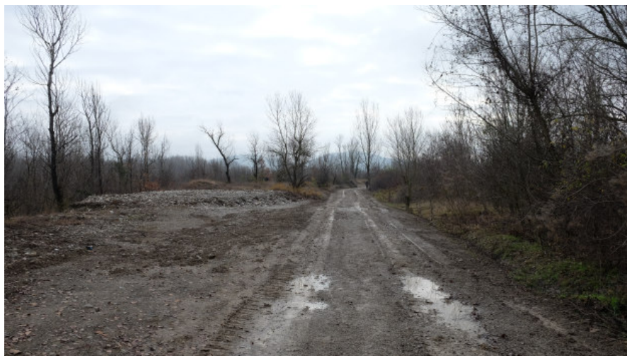
Foto 16: Tratto di pista camionabile in fregio al T. Enza che sarà utilizzata per il trasporto dei materiali da Sud