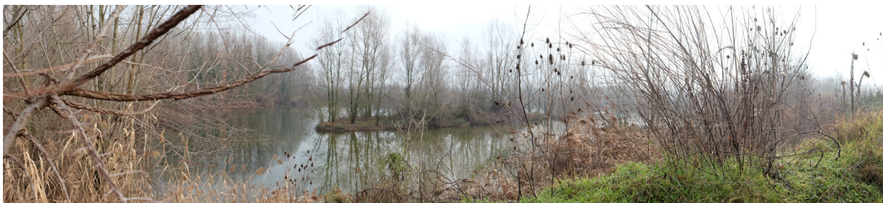
Foto 22: Area estrattiva rinaturata a zona umida nell'ambito della precedente fase attuativa all'interno del medesimo Polo G6 da Ovest