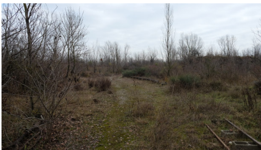
Foto 11: Tratto centrale del tragitto alternativo di collegamento alla pista in fregio al t. Enza da Ovest