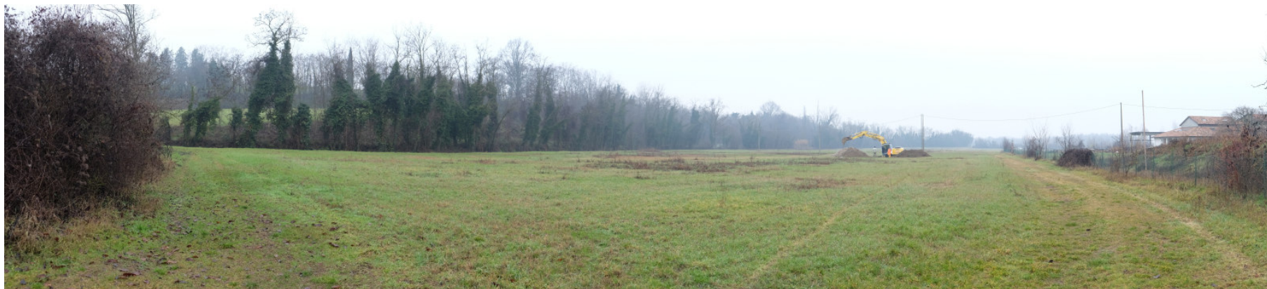
Foto 1: Panoramica dell'Ambito estrattivo 'Cà Campagna/Boschi' da Sud - Est